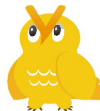
マスコットキャラクター 「ヨリー」

サイト名：YORIDORI (ヨリドリ) URL： https://www.yoridori.jp/ 開設日：10月10日(火) 運営：ケイティケイ株式会社